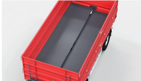
Podłoga wykonana z dwóch kawałków materiału pozwala na uzyskanie większej sztywności maszyny