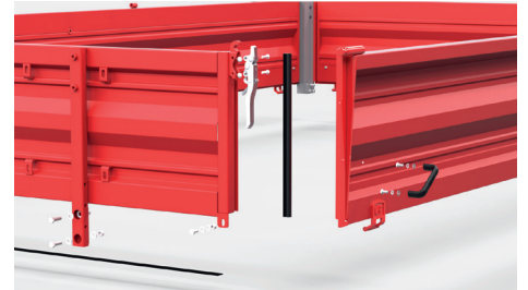
Przyczepy posiadają specjalne uszczelki które zapewniają odpowiednią szczelność