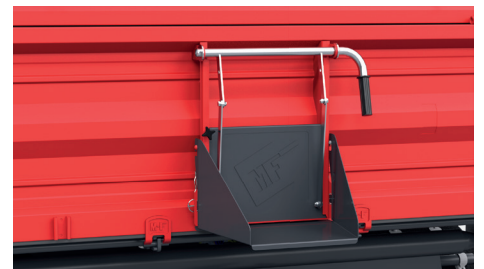
Szyber z rynną - daje możliwość precyzyjnej regulacji przepływu materiałów, co umożliwia łatwe i efektywne rozładunek zbiorów